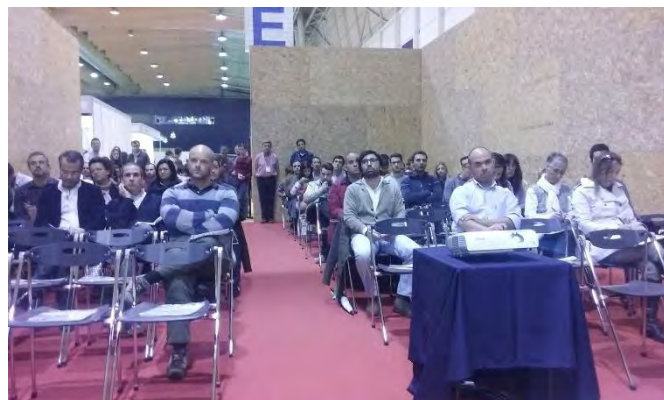
FILAGRO - LISBOA